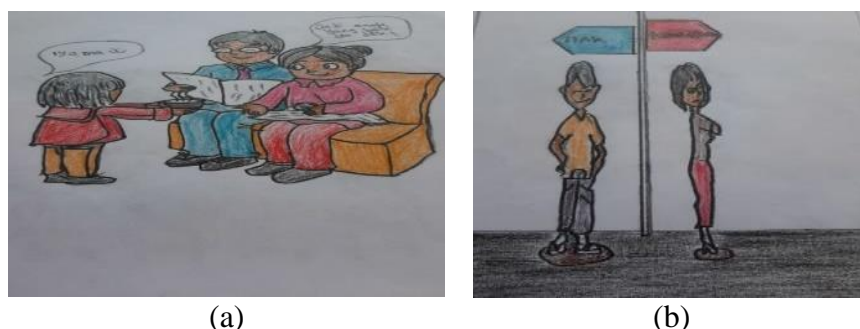
(a) (b) Gambar 1. Desain Produk Awal

Penjelasan desain produk yang sudah di revisi pada revisi produk awal pembuatan yaitu dengan cara digambar secara manual, setelah digambar secara manual lalu discan, setelah discan melakukan pewarnaan dan memberikan kalimat percakapan melakukan gambar grafis dengan menggunakan computer.