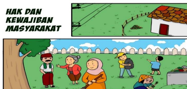
Gambar 2. Produk Hasil Revisi

Penjelasan desain produk yang sudah di revisi pada revisi produk awal pembuatan yaitu dengan cara digambar secara manual, setelah digambar secara manual lalu discan, setelah discan melakukan pewarnaan dan memberikan kalimat percakapan melakukan gambar grafis dengan menggunakan computer.