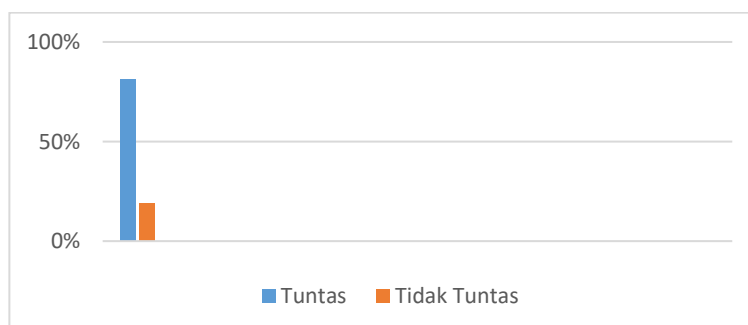
Gambar 2. Penilaian keterampilan menulis puisi pada siswa sesudah penerapan media gambar siklus II

Berdasarkan hasil keterampilan dari siklus I yang diikuti 32 siswa, pada pelajaran Bahasa Indonesia baru 24 siswa atau 75% yang dapat memiliki keterampilan menulis puisi dan 8 siswa atau 25% masih belum memiliki keterampilan menulis puisi. Penyebab dari rendahnya keterampilan menulis puisi adalah karena kurang optimalnya pelaksanaan pembelajaran bahasa Indonesia dengan penerapan media gambar. Oleh karena itu peneliti akan melanjutkan ke siklus berikutnya yaitu siklus II.