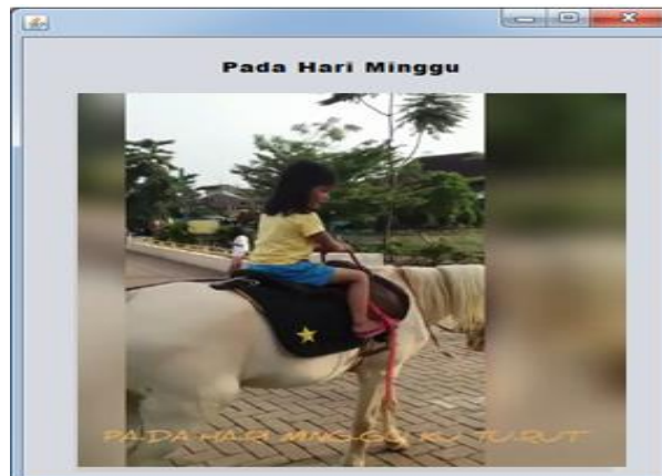
Gambar 3. Pelaksanaan Program Jawa

(e) peneliti melakukan evaluasi kegiatan pembelajaran yang telah dilaksanakan dengan melakukan bernyanyi dan tanya jawab; (f) peneliti membacakan doa dan pulang; (g) pelaksanaan tindakan pada pertemuan satu, dua, tiga pada siklus I ini kegiatan yang sama yaitu melafalkan lirik lagu sehingga anak dapat memahami kosa kata baru semakin meningkat. Setelah melakukan tindakan kelas maka peneliti melakukan pengamatan terhadap peserta didik dengan penilaian harian.