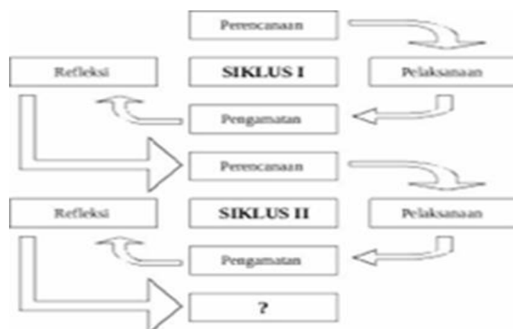
Gambar 1. Siklus Penelitian Tindakan Kelas

Penelitian ini adalah penelitian tindakan kelas (PTK), prosedur atau langkah-langkah yang akan dilakukan dalam penelitian ini dilaksanakan dalam kegiatan yang berbentuk siklus penelitian. Dalam penelitian ini peneliti menggunakan dua siklus dan pada masing-masing siklus terdiri atas empat tahap, yaitu: perencanaan, tindakan, observasi, dan refleksi (Arikunto, Suhardjono & Supardi, 2015). Berikut ini gambar alur langkah yang akan dilakukan dalam penelitian ini.