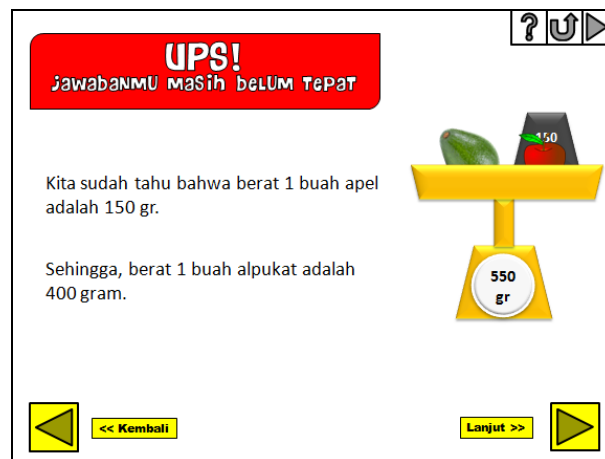
Gambar 3. Cuplikan Umpan Balik Jawaban yang Salah pada Sumber Belajar yang Dikembangkan

Produk yang dihasilkan dalam penelitian ini berupa sumber belajar berbentuk slideshow interaktif dalam bentuk file berformat *.ppt dengan spesifikasi sebagai berikut: (1) berisi tayangan slideshow yang menampilkan materi prasyarat, materi inti, contoh soal, latihan soal, dan pembahasan; (2) materi prasyarat adalah Operasi Aljabar, Persamaan Linear Satu Variabel (PLSV), dan Persamaan Garis Lurus; (3) materi inti mengacu pada SK/KD menurut silabus kurikulum yang berlaku; (4) contoh soal diharapkan akan memberikan siswa gambaran mengenai penyelesaian masalah nyata yang berkaitan dengan PLDV; (5) latihan soal dikemas dalam bentuk pilihan ganda. Ketika siswa meng-klik jawaban, akan muncul keterangan benar/salahnya jawaban mereka beserta pembahasan soal.