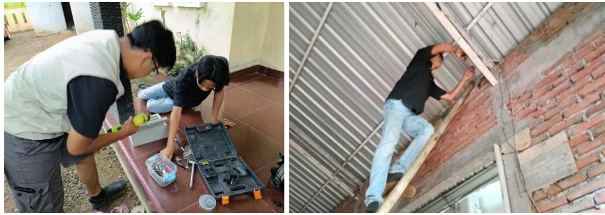
Gambar 3. Proses instalasi perangkat IoT dalam penggunaan sistem penerangan berbasis IoT di UMKM Gula Merah Sumber Madu di Kabupaten Kudus.