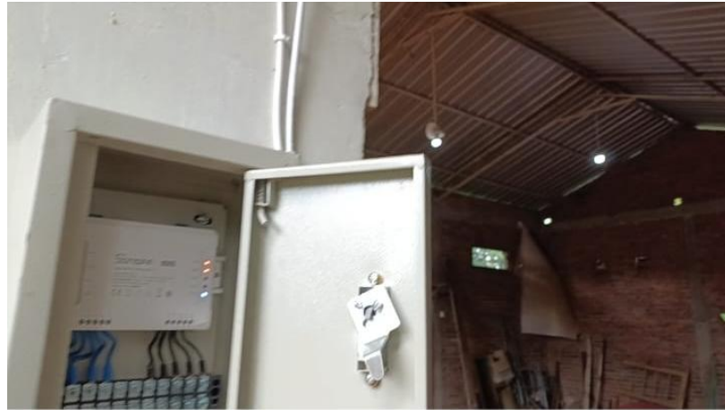
Gambar 6. Kondisi penerangan gudang gula merah setelah implementasi sistem IoT

Hasil wawancara menunjukkan bahwa proses produksi menjadi lebih efektif karena keterlambatan penyalaan lampu dapat diminimalkan. Secara teoritis, pencahayaan yang memadai dan stabil berkontribusi pada peningkatan produktivitas serta keselamatan kerja.