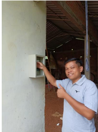
Gambar 4. Monitoring hasil penerapan sistem penerangan pintar dan sesi pendampingan lanjutan UMKM Sumber Madu.