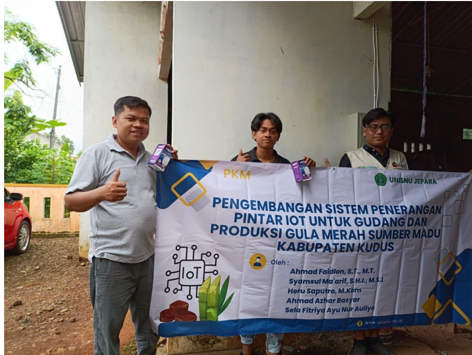
Gambar 7. Hasil pengabdian penerangan gudang gula merah setelah implementasi sistem IoT.