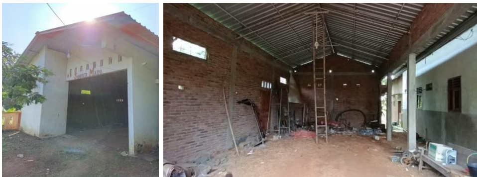
Gambar 1. Kegiatan observasi awal dan identifikasi kondisi sistem penerangan di UMKM Gula Merah Sumber Madu di Kabupaten Kudus.

Tahap persiapan dan survei lokasi dilaksanakan sebagai langkah awal kegiatan pengabdian kepada masyarakat dengan tujuan mengidentifikasi kondisi riil mitra UMKM Gula Merah Sumber Madu di Kabupaten Kudus. Pada tahap ini, tim pengabdian melakukan koordinasi awal dengan pengurus mitra, observasi langsung terhadap kondisi gudang dan area produksi, serta pemetaan titik-titik penerangan yang masih dikendalikan secara manual. Selain itu, dilakukan pengumpulan data terkait instalasi listrik, ketersediaan jaringan pendukung, pola penggunaan lampu, serta permasalahan yang sering muncul dalam operasional penerangan. Hasil survei ini menjadi dasar dalam perancangan sistem penerangan pintar berbasis IoT yang sesuai dengan kebutuhan mitra, baik dari aspek teknis, keselamatan kerja, maupun efisiensi energi.