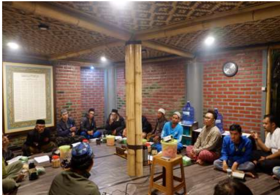
Gambar 2. Peserta pelatihan Ilmu Mawarits berbasis aplikasi i-Waris di Saung Darussalam Ciwidey

perempuan lebih dari dua, maka bagi mereka dua pertiga dari harta yang ditinggalkan; jika anak perempuan itu seorang saja, maka ia memperoleh separo harta. Dan untuk dua orang ibu-bapa, bagi masing-masingnya seperenam dari harta yang ditinggalkan, jika yang meninggal itu mempunyai anak; jika orang yang meninggal tidak mempunyai anak dan ia diwarisi oleh ibu-bapanya (saja), maka ibunya mendapat sepertiga; jika yang meninggal itu mempunyai beberapa saudara, maka ibunya mendapat seperenam. (Pembagian-pembagian tersebut di atas) sesudah dipenuhi wasiat yang ia buat atau (dan) sesudah dibayar hutangnya. (Tentang) orang tuamu dan anak-anakmu, kamu tidak mengetahui siapa di antara mereka yang lebih dekat (banyak) manfaatnya bagimu. Ini adalah ketetapan dari Allah. Sesungguhnya Allah Maha Mengetahui lagi Maha Bijaksana.