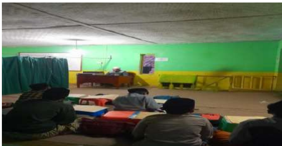
Gambar 1. Pengajian di Majelis Taklim Al-Muslimiyyah

Kegiatan pelatihan penggunaan aplikasi waris berbasis internet dan gadget menjadi salah satu solusi dalam mempersiapkan generasi selanjutnya yang memiliki kemampuan komprehensif dalam ilmu waris atau faraidh yang dapat menggunakan kemudahan teknologi dalam memecahkan masalah kemasyarakatan, khususnya waris.