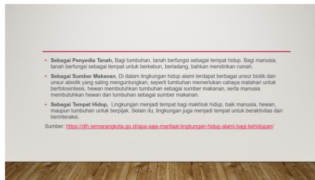
Gambar 4. Lanjutan dari uraian di Gambar 3

Selanjutnya, seperti pada Gambar 4, yaitu keberadaan mikroorganisme di lingkungan alam sekitar kita. Mikroorganisme dapat membuat tumbuhan menjadi subur dan sangat baik bagi pertumbuhan tumbuh-tumbuhan. Contoh lainnya yang ada di lingkungan alam kita adalah oksigen. Oksigen membuat kita manusia dapat bernafas, begitu juga bagi hewan dan tumbuhan. Seperti halnya manfaat air, jika makhluk hidup kekurangan oksigen, maka bisa mengakibatkan kematian.