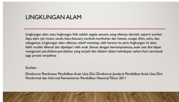
Gambar 1. Uraian tentang Pengertian Lingkungan Alam

Pemateri selanjutnya menerangkan tentang apa saja yang mereka bisa amati dari lingkungan alam sekitar. Dalam uraiannya, seperti pada Gambar 2, pemateri memaparkan bahwa lingkungan yang sifatnya alamiah seperti air, hutan, bebatuan, tumbuhan, hewan, sungai, iklim, serta suhu disebut sebagai lingkungan alam. Dalam hal ini, pemateri juga mengajak para peserta untuk mengenali contoh-contoh lingkungan alam tersebut.