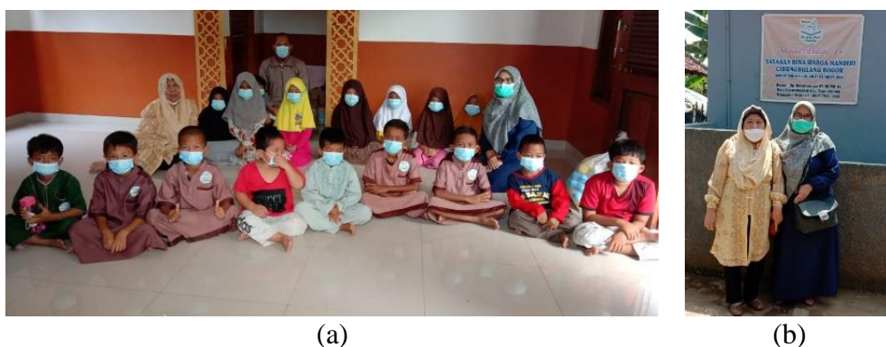
Gambar 6. Akhir kegiatan dan Foto bersama

Gambar 5(a) menunjukkan tentang suasana pada saat para santri mendengarkan pemateri memaparkan materi yang disampaikan oleh dosen-dosen dari IBI K57 dengan sangat antusias dan suasana yang menyenangkan. Pada salah satu uraian tersebut, pemateri juga mencontohkan menggunakan masker di masa pandemi ini, dimana masker ini melindungi masuknya kuman lewat hidung dan mulut. Sedangkan Gambar 5(b) merupakan para pemateri berfoto bersama santri dan pengurus Yayasan Bina Warga Mandiri setelah menyampaikan uraian dan melakukan sesi tanya jawab tentang lingkungan alam sekitar. Setelah kegiatan selesai, acara pengabdian diakhiri dengan foto bersama antara pemateri, santri, dan pengurus Yayasan, seperti pada Gambar 6.