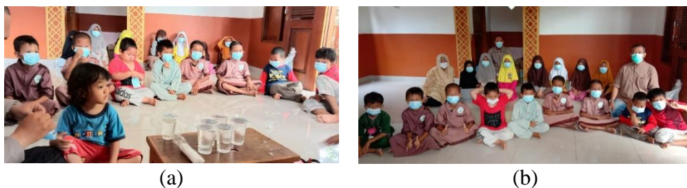
Gambar 5. Santri Menerapkan Protokol Kesehatan dan Mendengarkan Materi

Selain uraian yang cukup serius seperti dipresentasikan pada Gambar 4, pemateri juga menerangkan manfaat lain yang lebih mengena dengan bahasa anak-anak seusia santri-santri di Yayasan Bina Warga Mandiri. Pemateri menerangkan bahwa mereka juga dapat menjadi sehat dan memiliki tubuh yang segar bugar bermain di alam seperti saat mereka memanjat pohon tertentu, berayun-ayun, merayap di sebuah terowongan ataupun bermain dan berguling-guling di atas rerumputan.